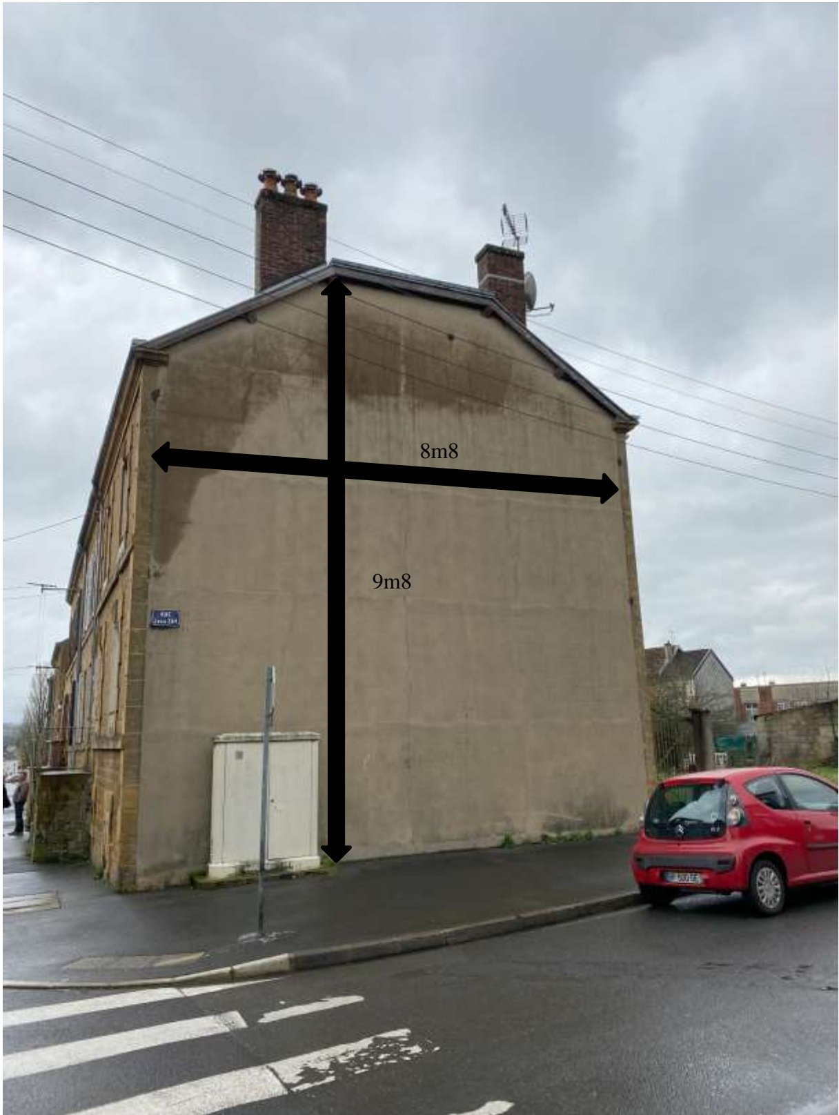
1 rue Marceau