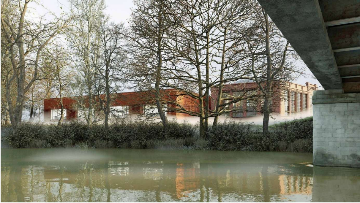
fig. 2 vue sud